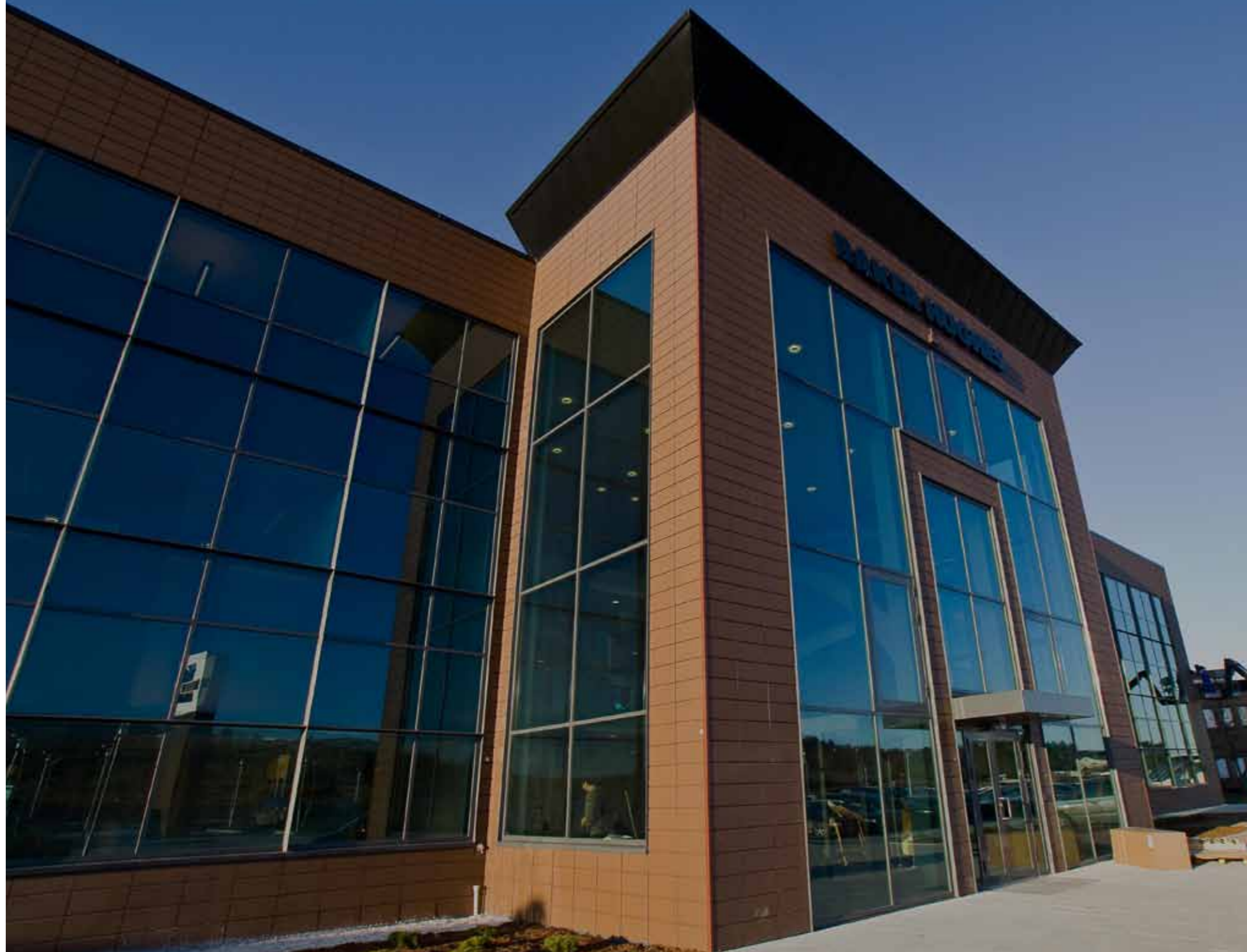
Baker Hughes phase 1.